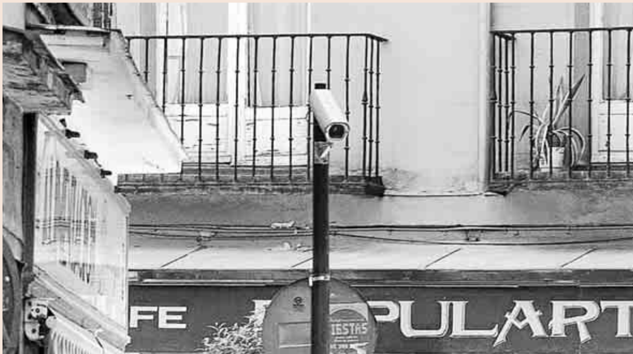
El uso de cámaras de vigilancia está sujeta a la normativa de protección de datos.

Sin embargo, no es el único riesgo que corren las pymes en materia de privacidad y cumplimiento normativo. La última tendencia detectada por el sector consiste en lo que llaman "LOPD a coste cero". Según la Asociación Profesional Española de Privacidad (APEP) "consiste esencialmente en un desvío directo o encubierto de fondos de formación que acaban financiando servicios de consulto-